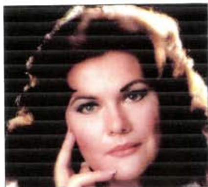
Marton Éva az operavilág nagyszonyja .. 13