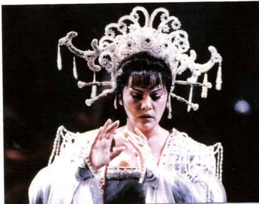
Turandot, San Francisco 1985.

Kinyitni kis ablakokat, melyekben látom a szépség és tudás iránti vágyat, érezem a lobogó tüzek melegét